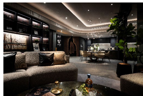
【モデルルーム（トップスイートフロア）】