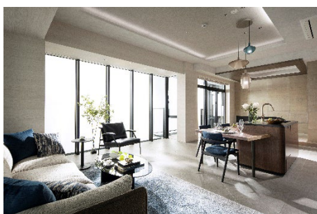
【モデルルーム（アップersイートフロア）】