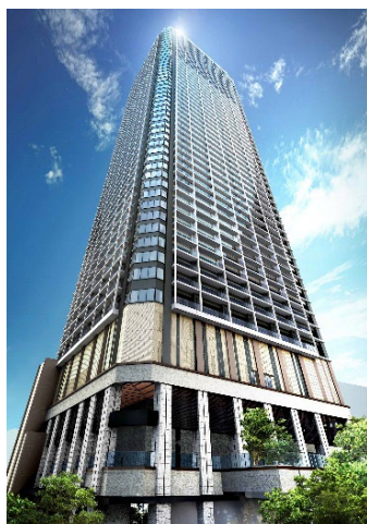
外観（イメージパース）

大和ハウス工業株式会社（本社：大阪府大阪市、社長：大友 浩嗣）と東京建物株式会社（本社：東京都中央区、社長：小澤 克人）、京成電鉄株式会社（本社：千葉縣市川市、社長：天野 貴夫）は、千葉県船橋市の「西武船橋店本館」跡地において、2026 年 2 月 7 日より、分譲マンション「プレミストタワー船橋」（地上 51 階・地下 1 階建て、総戸数 677 戸）の販売を開始します。