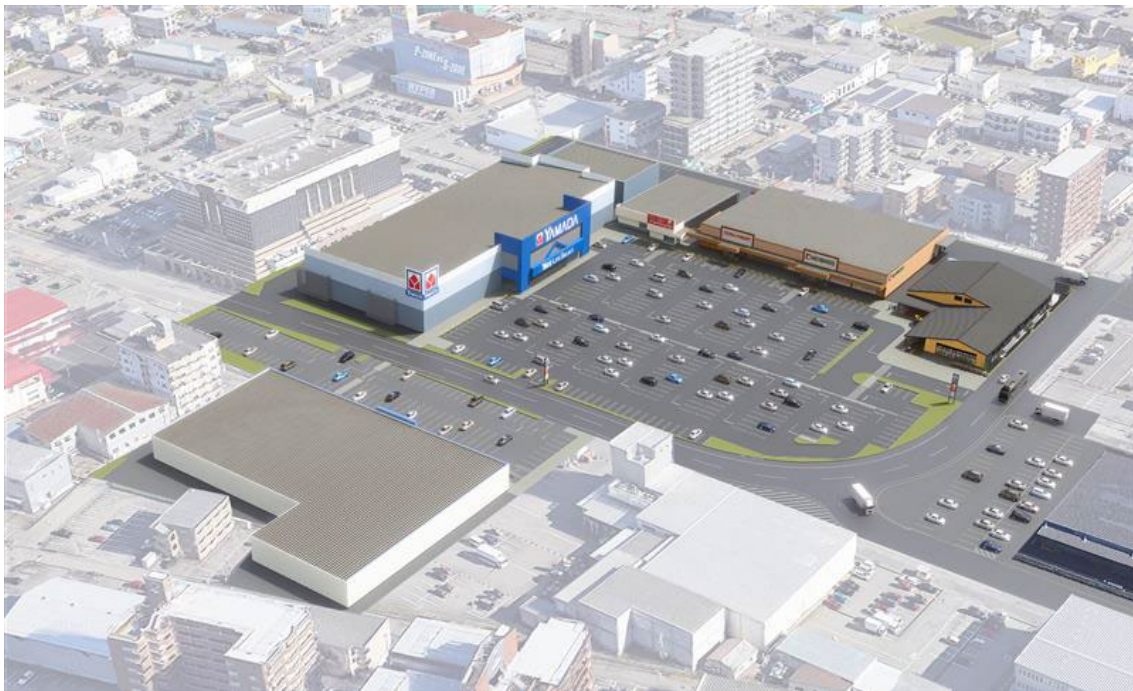
【現在建設中の商業施設と「にぎわい施設」の完成イメージ】