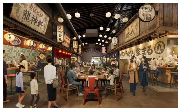
【「にぎわい施設」内観イメージ】