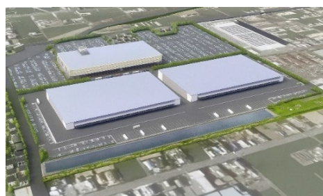
【左側：商業施設外観イメージパース 右側：商業施設区画・産業・物流施設区画イメージパース】 ※実際の施設とは異なる場合があります

大和ハウス工業は、工業化建築のパイオニアとしての技術力、多様な事業用施設で培ったノウハウとコンサルティング力、大規模団地の分譲で培われたデベロッパーとしての企業力を活かし、これまで全国各地で工業団地や産業団地の開発を手掛けてきました。