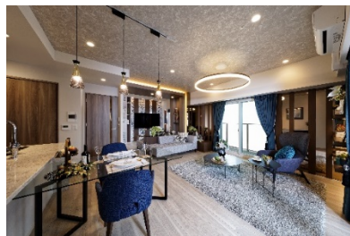
【プレミスト徳山ザ・レジデンス】

「プレミスト徳山ザ・レジデンス」は、新幹線停車駅である JR「徳山駅」にペデストリアンデッキ※3 で直結する駅徒歩 2 分の新築分譲マンションです。建物デザインは、山口県出身で国内外において活躍する光井純氏が代表を務める光井純 & アソシエーツ建築設計事務所が監修しており、街のランドマークとなるようデザインされています。