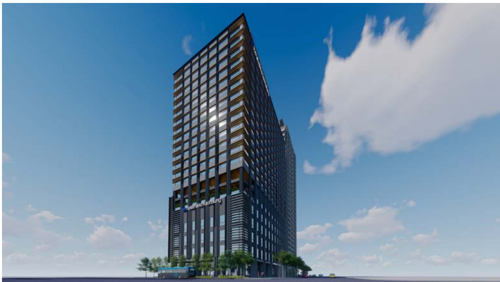
【「(仮称) 高雄プロジェクト」イメージ】

※1. 「高雄ライトレール水岸線」、「高雄展覽館」、「海洋文化流行音楽センター」、「高雄港国際旅客船ターミナル」、「高雄市立図書館総館」の公共事業。