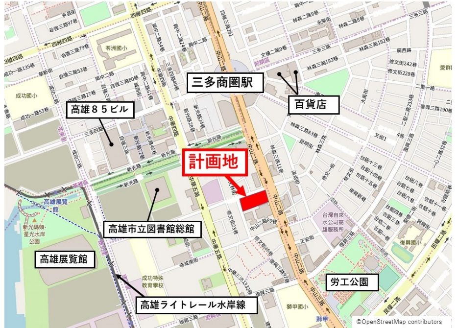
【「(仮称) 高雄プロジェクト」位置図】