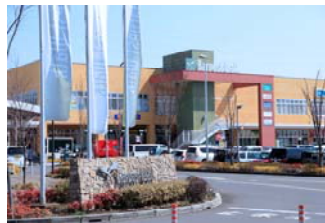
「おやまゆうえん ハーヴェストウォーク小山」