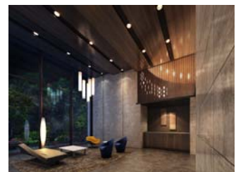
【エントランスイメージ】

当物件の外観デザインには、小山市の伝統工芸である「結城紬」の縞模様や格子模様をモチーフに、白とグレーのガラス手摺をアクセントにしました。エントランスには、小山市の「オモイガワザクラ」をイメージした照明や、壁上部のデザインに小山市の伝統行事の「流し雛」を表現するなど、小山市の文化を取り入れています。