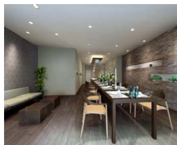
【パーティールーム】