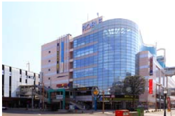
小山駅西口再開発ビル「ロブレ」

また「駅東公園」(徒歩 5 分) や「城山公園」(徒歩 14 分)、「思川緑地」(徒歩 19 分) など豊かな自然環境も充実しています。