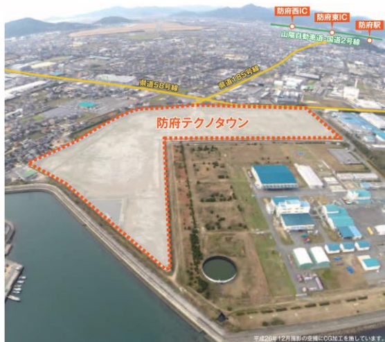
【防府テクノタウン】