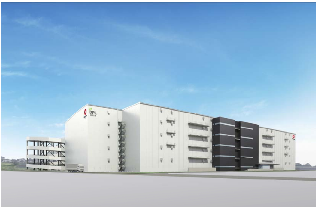
「DPL 福岡宇美」外観パース