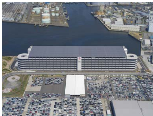
ダブルランプウェイ (イメージ)

※5. トラックが倉庫に荷物を運び込んだり、積み込んだりするため停車する場所のこと。