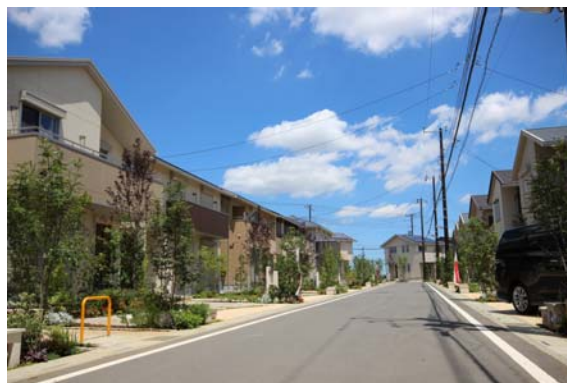
埼玉県吉川市 「スマ・エコ シティ吉川美南」