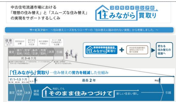
『「住みながら」買取サービス』

URL http://sumikae.cosmos-direct.jp/contents/code/living_purchase