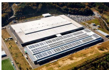
【岡山工場太陽光発電所】