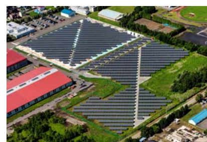
【旧札幌工場跡地太陽光発電所】