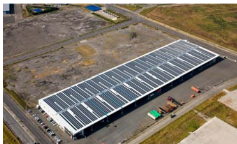
【ひびき国際物流センター太陽光発電所】