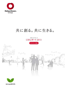
「CSR レポート 2013」(PDF)