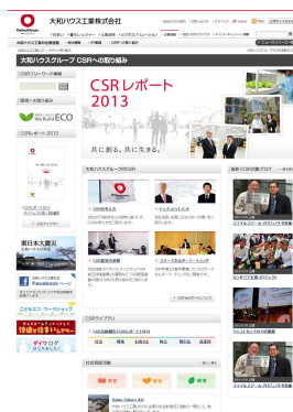
「CSR WEB サイト」( http://www.daiwahouse.co.jp/csr )