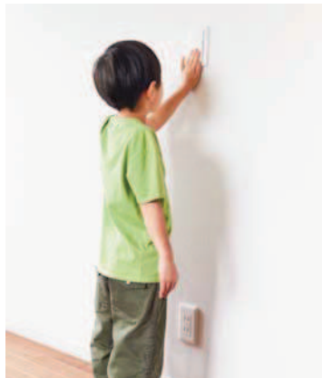
ファミリースイッチ