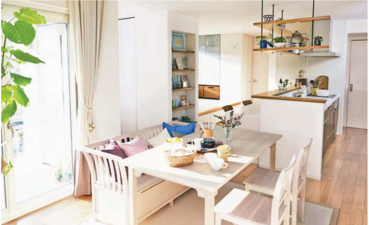
『ハッピーハグⅢ』 “ハッピーキッチン”