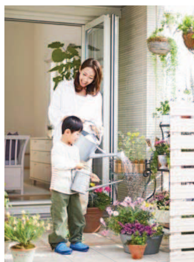
“シーズンアプローチ”