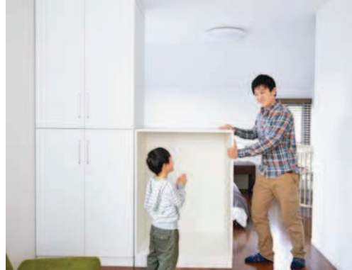
“フレックスステージ”