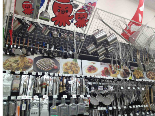
業務用調理道具類