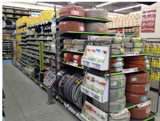
エアコン工事資材