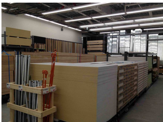
十分な在庫量の建築用資材

約 7,140 m 2 の広い店内には、合板・建築用木材をはじめ、石膏ボードや屋根材・サイディング、フローリングなどの各種床材から、天井材、建具、設備機器等の資材については、いつでもご用命いただいてもお応えできる十分な在庫量を確保しています。