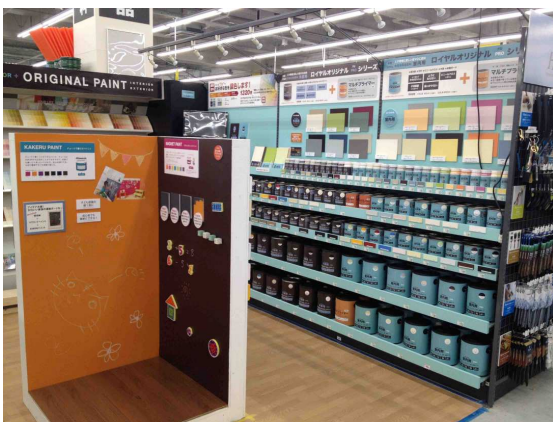
豊富な品ぞろえの塗料売場

また、大阪市内中心部のホームセンターでは初の大型トラック 4 台が同時に作業できる屋根付きの資材積込場を完備しました。