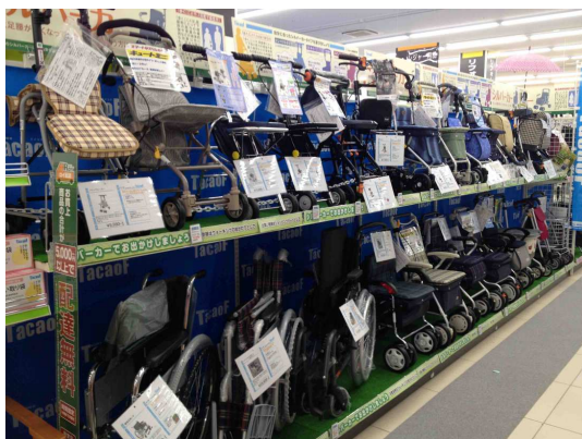
種類豊富なシルバーカー