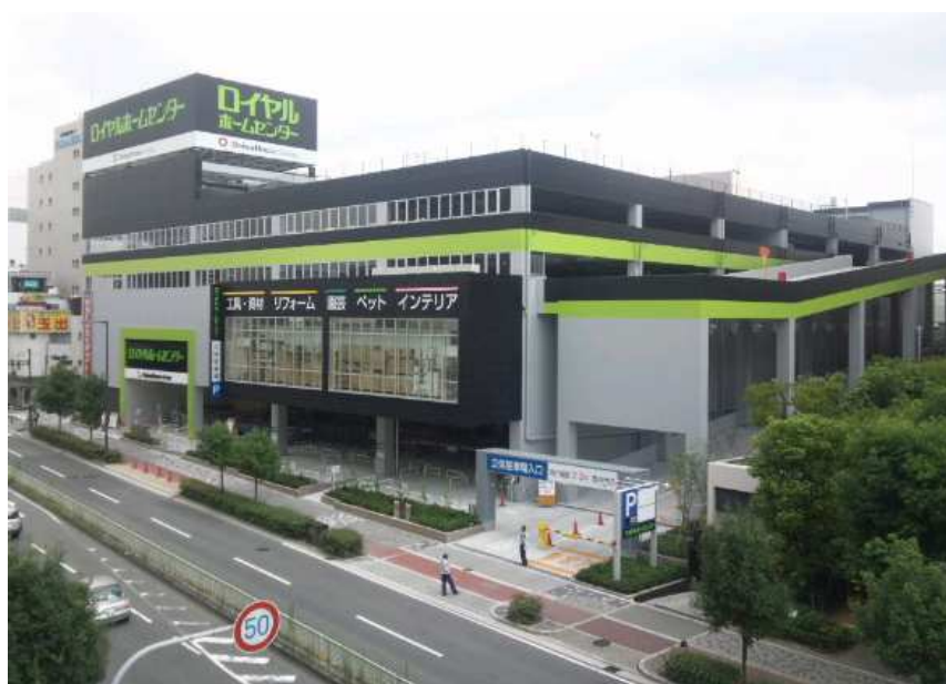
【ロイヤルホームセンター森ノ宮店 (外観)】