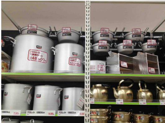
業務用サイズの鍋