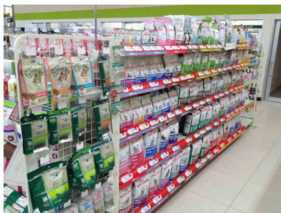
約 100 種類のプレミアムフード