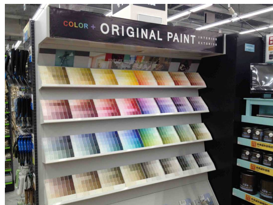
塗料調色サービス