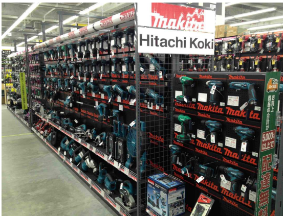
豊富な品ぞろえの電動工具