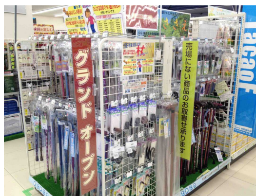
高齢者向けステッキ (杖)