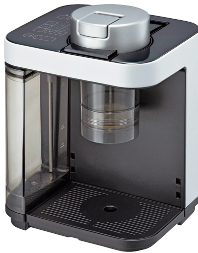
フロストホワイト(WF) ACQ-X020