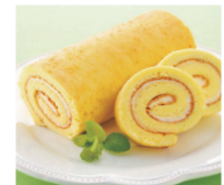
ロールケーキの生地が焼けます。