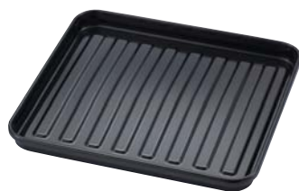
ホーロー加工の調理トレイ (KAS-G型)

蓄熱性の高いホーロー加工の調理トレイで食材をこんがりふっくら焼きあげます。また、KAS-B型はシリコン加工を施してこびりつきにくく、お手入れもカンタンな調理トレイを採用しています。