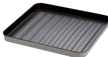
シリコン加工の調理トレイ (KAS-B型)