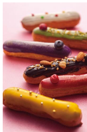
Nampo Sweet Devil エクレア