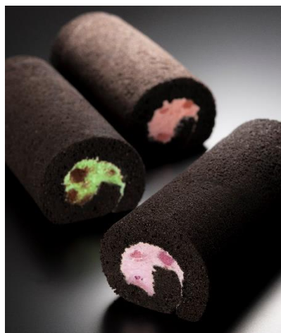
Nampo Sweet Devil デビルロールケーキ

この件に関するお問い合わせ先 株式会社 JALUX 事業企画室 空港リテール課 TEL:03-5756-9110