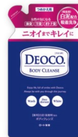
デオコ®薬用ボディクレンズ <つめかき用>