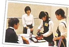
お茶のいれ方講座