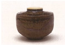
志戸呂 茶入 銘・初桜

「綺麗さび」といわれるお茶のスタイルは、江戸時代の大名茶人小堀遠州が、「わび」「さび」の茶を継承しながら、王朝の雅や和歌の世界と融和させ確立したもので、「ふじのくに茶の都ミュージアム」のデザインコンセプトにもなっています。