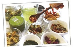
オリジナルティーづくり