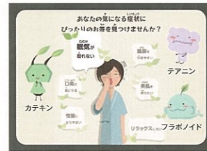
お茶の機能性と成分の体験型展示

映像や実演で世界の喫茶文化を分かりやすく紹介します。また日本の茶文化や静岡の茶業の歴史、機能性の最新情報など体感・体験しながら楽しく学べます。