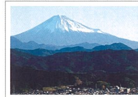
レストランから見える富士山

綺麗さをコンセプトにデザインされた空間で、美味しいお茶とお茶を用いた絶品スイーツやお食事、お買い物をお楽しみください。