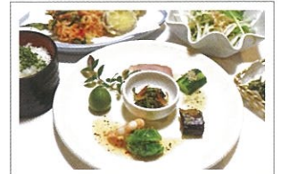
お茶づくしのカフェレストランメニュー