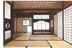
ミュージアムに復元された小堀遠州ゆかりの茶室と庭園