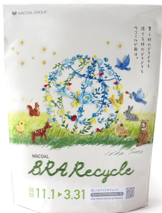
「ブラ・リサイクルバッグ」

（ワコール ブラ・リサイクル キャンペーンサイト： http://www.wacoal.jp/braeco/ ）