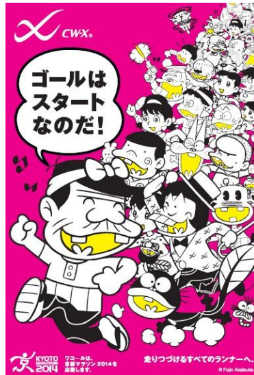
「赤塚不二夫×CW-X ランナー応援プロモーション」 メインビジュアル

2014年は、漫画『天才バカボン』などで知られ、世代を超えて愛されつづけている漫画家・赤塚不二夫が描いた人気キャラクターが登場。「ゴールはスタートなのだ!」というユニークなメッセージとともに、ランナーの興味を喚起し、ブランドの認知向上を図るとともに、全国のランナーを応援します。