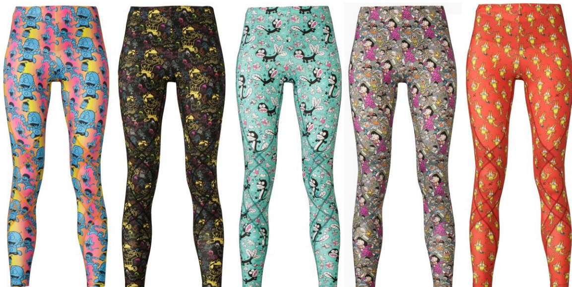
「チビ太」 【北海道・東北】

(※3) スパイラル：株式会社ワコールが「文化の事業化」を目指して、1985年東京・青山にオープンした、「生活とアートの融合」をコンセプトにする複合文化施設です。(東京都港区南青山5-6-23 http://www.spiral.co.jp )