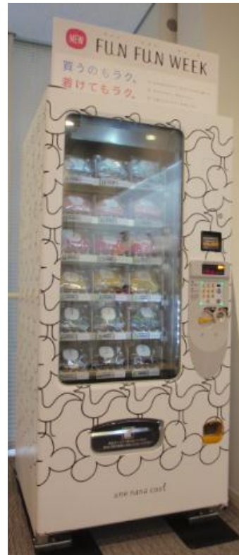
【 『FUN FUN WEEK』 自動販売機 】

※ 『FUN FUN WEEK』、『パワーパネル』、『バージスライン』は株式会社ワコールの登録商標です。