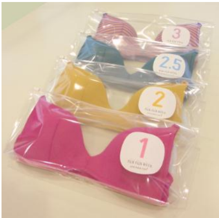
【 4つのサイズから選べる『FUN FUN WEEK』 】