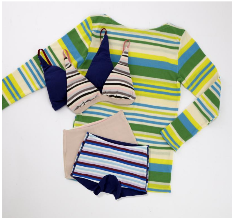
シャツ LS6054（カラー：ブルー） ブラジャー LB3361、ショーツ LF4361（カラー：共にピンク、ブルー）

『docchi・nimo』シリーズは1月下旬より順次、全国の「ランチ」直営店13店舗、および、ZOZOTOWN、ワコールウェブストアで販売し、シリーズ10品番で6,000枚の売上を目指します。（2013年1月～8月）