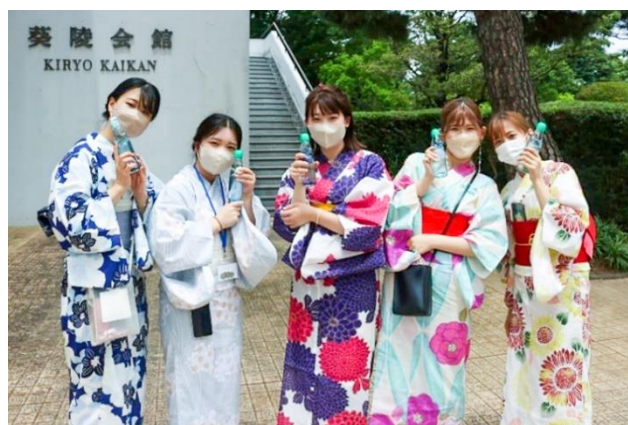
浴衣姿で暑気払いを楽しむ学生

学生からは「打ち水体験は初めて」という声も聞かれ、用意した約200本のラムネが売り切れになるなど大盛況。浴衣を着て参加した女子学生（現代法学部3