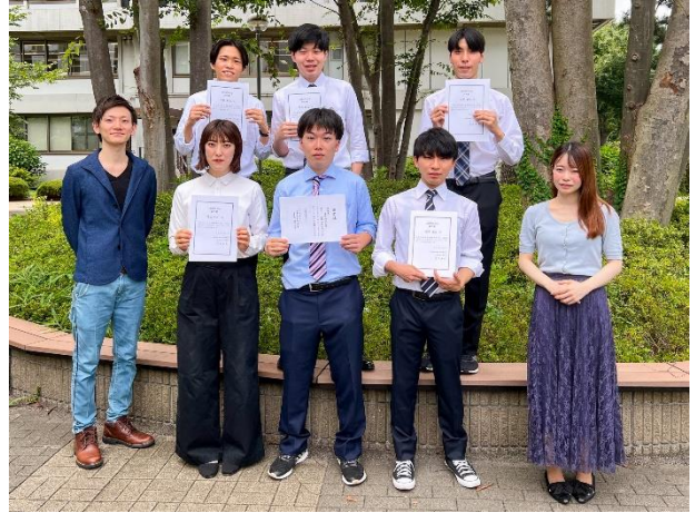
若狭専任講師(写真下段左)とゼミ生

ゼミ長を務めた学生（現代法学部3年）は、敢闘賞受賞について「国際法を学び始めて日が浅く不安だけでしたが、ゼミ生が一丸となって精一杯取り組んだ結果であり、とても嬉しく思います。この経験を今後の人生にも活かしていきたいです」と喜びを語りました。