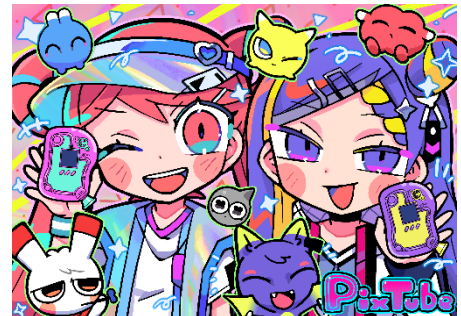
寺田てら描き下ろしオリジナルキャラクター

「PixTube (ピクチューブ)」は、アナログな操作がそのままデジタル表現へとつながる仕掛けが特徴の液晶トイです。レバーをひっぱってはじく方向と連動して光のキャラクターがチューブ内を駆け巡り、お世話やミニゲームが楽しめます。光のキャラクター「ピクメイト」は、Z世代を中心に高い支持を集めるイラストレーター・寺田てらによる描き下ろしのオリジナルキャラクターです。アイスや動物などをモチーフにした、ポップで個性豊かな20種類以上のキャラクターがレバー操作に連動して現れます。