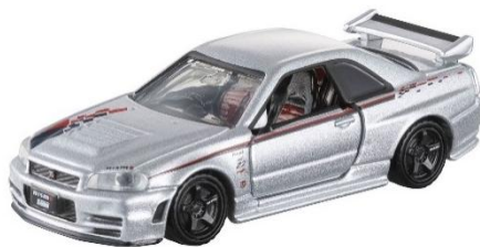
「TOMICA EVENT MODEL tomica PREMIUM NISMO R34 GT-R Z-tune Proto.」 （価格：HKD69.9）

*「Japan Mobility Show 2025」 イベントオリジナル商品を香港でも販売します。