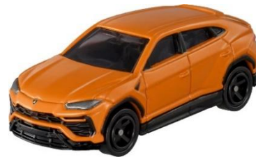
「TOMICA SHOP ORIGINAL LAMBORGHINI URUS」 （価格：HKD59.9）

*「Japan Mobility Show 2025」 イベントオリジナル商品を香港でも販売します。