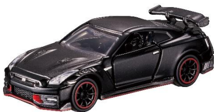
★香港では TOMICA BRAND STORE のみ★ 「TOMICA BRAND STORE ORIGINAL tomica PREMIUM NISSAN GT-R NISMO Special edition」 （価格：HKD69.9）

(※3) その他「TOMICA BRAND STORE」（上海・北京・広州・クアラルンプール）と大人向けのトミカショップ「トミカキダルトセレクトストア」（4店舗：上海2店舗、北京1店舗、杭州1店舗）でも展開。