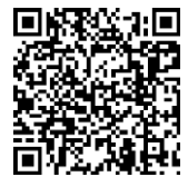
アプリダウンロード

権利表記：© TOMY IBIS Co.,Ltd. ©WAO CORPORATION.All Rights Reserved.