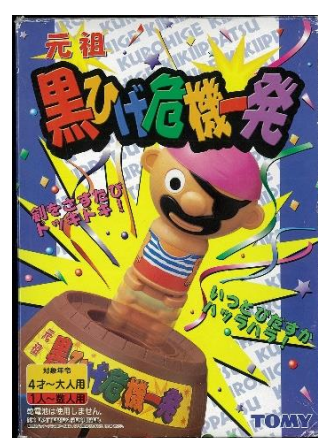
「元祖黒ひげ危機一発」 (4代目・1995年)