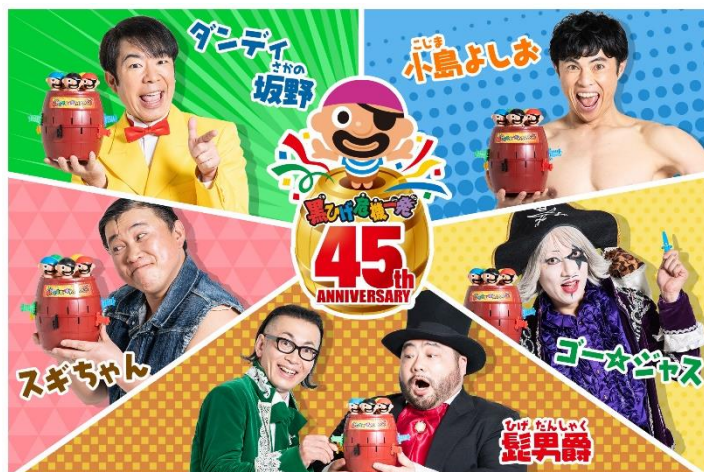
コラボレーションする5組の“一発屋芸人”