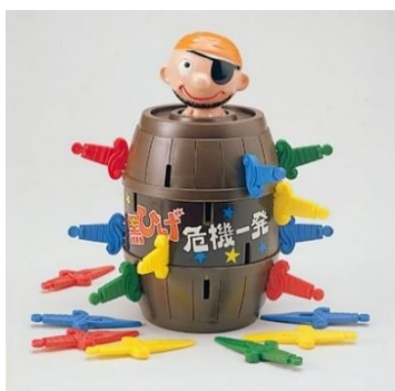
「黒ひげ危機一発ゲーム」(初代・1975年)

1975年(昭和50年)7月1日に発売された「黒ひげ危機一発」は、これまでに80種類を発売し(「超飛び黒ひげ危機一発MAX5」を含めると81種類)、世界47の国と地域で累計出荷数1,500万個を超えるロングセラー商品です。「単純明快なルールで誰もが楽しめる」「ハラハラドキドキの感覚」「すぐに勝負がつく」ことなどが、世界共通、老若男女問わず愛され続けています。遊び方は、ひとりずつ順番にタルの穴に剣を刺し、タルの中の「黒ひげくん人形」を飛び出させた人が負けです(※)。誰が「黒ひげくん人形」を飛ばすかをハラハラドキドキしながら、みんなが一緒に同じ時間、体験を共有し、コミュニケーションを楽しんでいただくことができます。