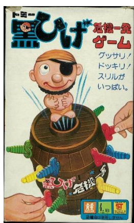
「黒ひげ危機一発ゲーム」 (初代・1975年)

ルール変更の背景には1976年から1988年まで放送された当時人気のクイズ番組で、飛び出した剣を刺した解答者の得点がゼロになったり、飛び出る「黒ひげくん人形」を受け止められないと豪華賞品を逃したり、本来と逆のルールで使われたこと、また、飛び出すときにビックリしている様子が「負け」を想起させることなどがあったといわれています。