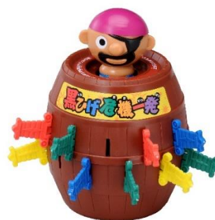
「黒ひげ危機一発」(6代目・2011年～現在)