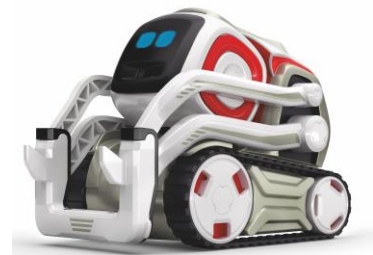
【 COZMO(コズモ) 本体 】

充電ドックで COZMO(コズモ)を充電します。約20分の充電で、約80分遊ぶことができます。スマートフォンやタブレットなどにダウンロードしておいたアプリを立ち上げ COZMO(コズモ)本体と接続すると、COZMO(コズモ)が起きて充電ドックから出てきます。COZMO(コズモ)は本体下部の側面にある2つのタイヤを使って移動し、液晶ディスプレイを搭載した顔と上下に稼働するアームを使ったしぐさで、1,000種類以上の感情を豊かに表現します。