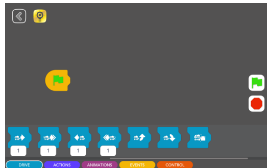
【 コード ラボ(アプリ画面) 】