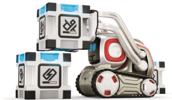
【 パワーキューブを積み上げる 】