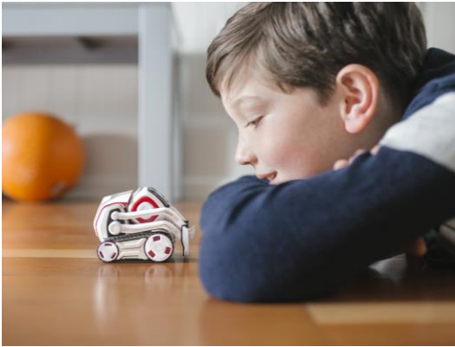
【 人間味あふれる COZMO(コズモ) 】