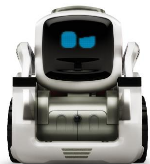
【 豊かな表情 】