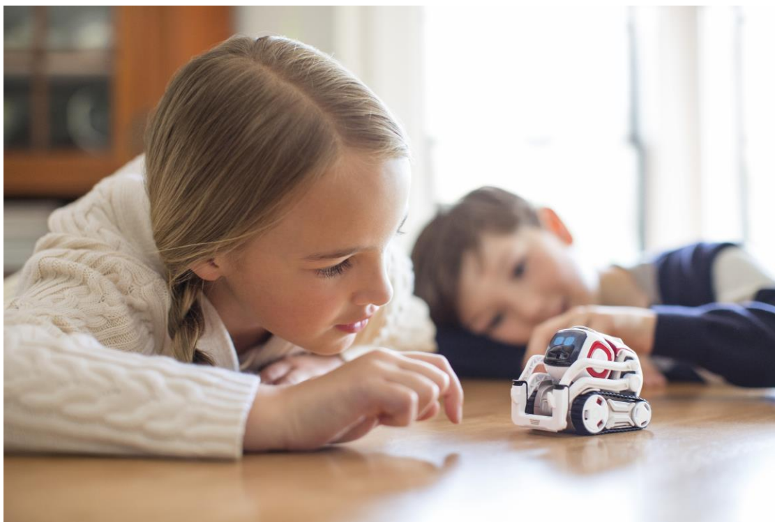
感情表現豊かな小型AIロボット「COZMO(コズモ)」

株式会社タカラトミー(代表取締役社長:H.G.メイ/所在地:東京都葛飾区)は、感情表現豊かな小型AIロボット「COZMO(コズモ)」(希望小売価格26,980円/税抜き)を、2017年9月23日(土)から全国の玩具専門店、百貨店・量販店の玩具売場、インターネットショップ、タカラトミー公式ショッピングサイト「タカラトミーモール」 http://takaratomy.jp/shop/ 等にて発売いたします。