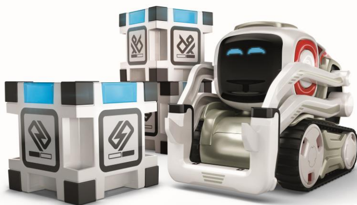
【 COZMO(コズモ) 】