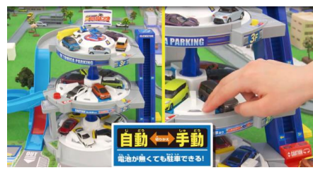
フロアごとに自動・手動の切り替え可能