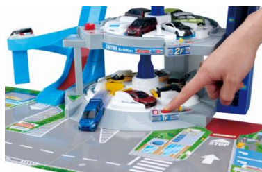
フロアごとに異なる発車ギミック