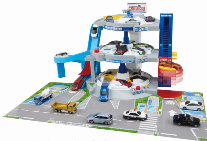
最大18台のトミカを駐車可能

HP： http://www.takaratomy.co.jp/products/tomica/tettei/world/17_02/index.htm