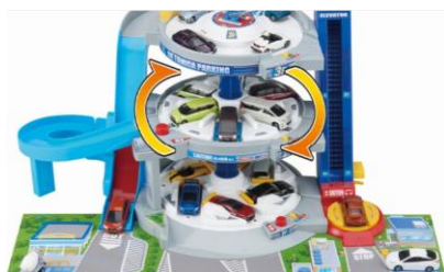
3つの駐車フロアが自動で回転