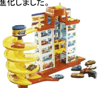
「トミカパーキング」(1972年)

これまでの「トミカパーキング」はエレベーターによる各階への駐車遊びを中心としたビル型の建物をモチーフにしていたのですが、「ぐるぐるシュート!! DXトミカパーキング」では次世代駐車場をイメージした円形駐車場に形状を変え、各フロアが自動で回転するとともに、それぞれ異なる発車機能を搭載した商品として進化しました。