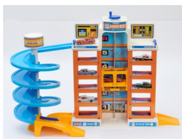
「トミカパーキング」(1981年)