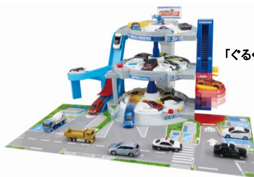
「ぐるぐるシュート!! DXトミカパーキング」

また、お子様から大人までより幅広い年齢層の方に楽しんでいただけるよう、「トミカ」「プラレール」の歴史がわかる展示や大人向け商品の展示、思い出に残る写真をたくさん撮っていただけるようなフォトスポットやカフェなど、ご家族で一日楽しむことができる内容となっています。