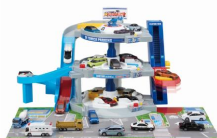
「ぐるぐるシュート!! DXトミカパーキング」