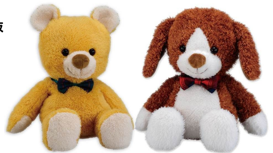
左のくまは「ハッピー」、右の犬が「ラッキー」

お腹のボタンの操作と音声出力だけで色々な会話ができる点が、目に障害がある子も一緒に楽しむことができ、共遊玩具として評価されました。また、絵本「ハッピーとラッキーのどうぶつえん」に貼りつけることのできる点字シールを、希望者に無料で差し上げています。ぬいぐるみとの会話や音楽、クイズが楽しめ、状況にあったおしゃべりがたくさんあります。