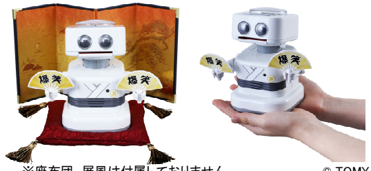
※座布団、屏風は付属していません。

2020年まで毎日ギャグで家族を笑顔にしてくれるコミュニケーション性と、電波時計内蔵という実用性を評価していただきました。