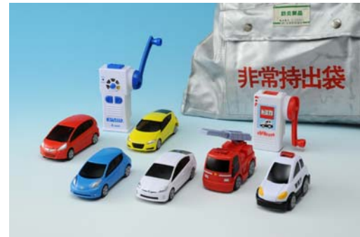
左4車種: 小学生向け「EDASH」