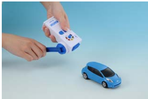
実写をモチーフにした 「EDASH」(01 NISSAN LEAF)