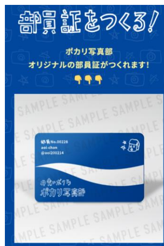
<特設サイト 部員証作成画面>