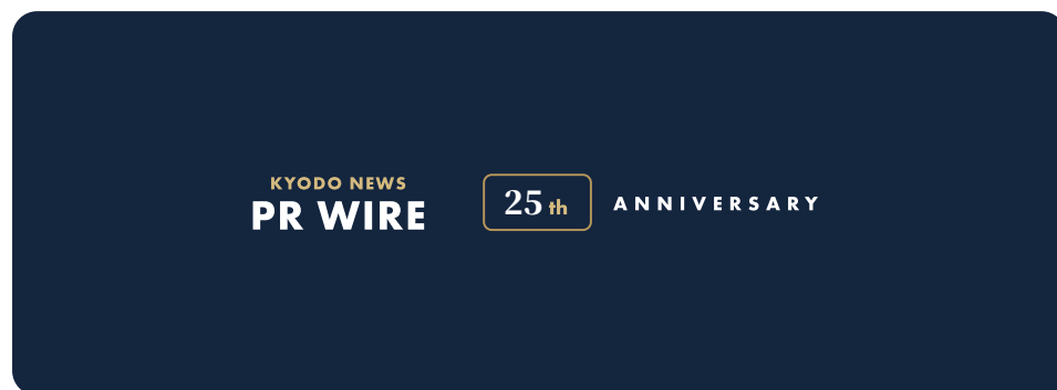
Full (horizontal) / フル（横） / メイン・バナー

記念ロゴは用途に応じた4種で構成されます。各種に濃紺地用・白地用を用意しています。