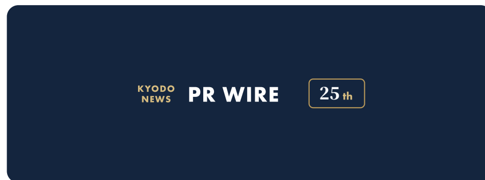
Compact / コンパクト / ヘッダー・署名