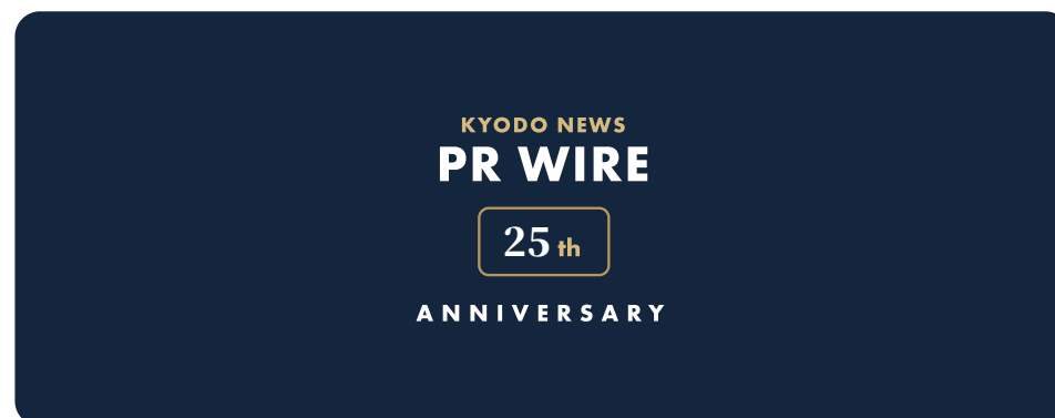
Full (vertical) / フル（縦積み） / SNS・スクエア