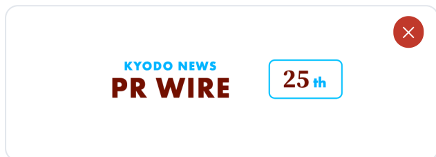
指定色以外での使用