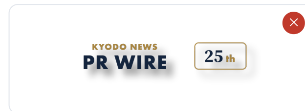
影など効果の付加