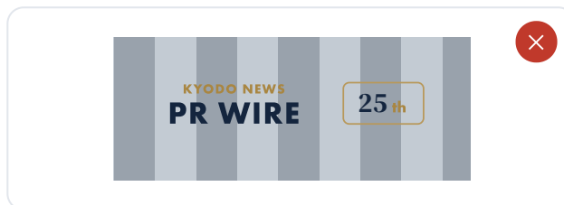
低コントラスト背景への配置