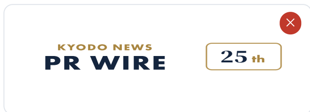
縦横比の変更・変形