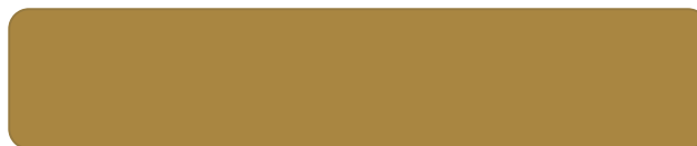
Gold Deep (白地)