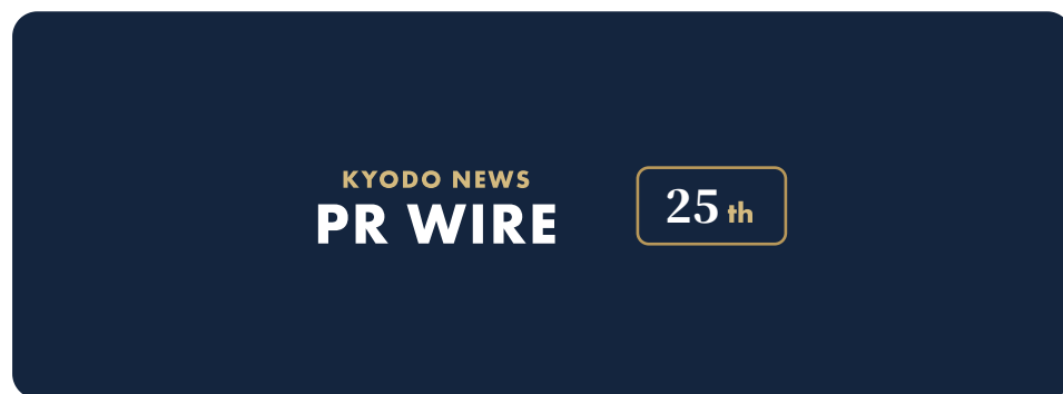
Standard / スタンダード / 資料・汎用